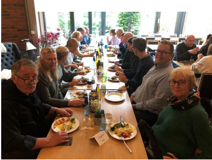
Avdelingsseminar på Vetre i september