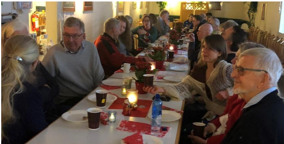
Julelunsj i 'kantina'