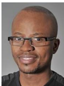
Statistiker (AFE Oslo)