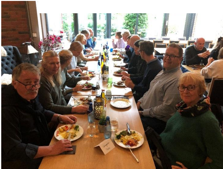
Avdelingsseminar på Vetre i september