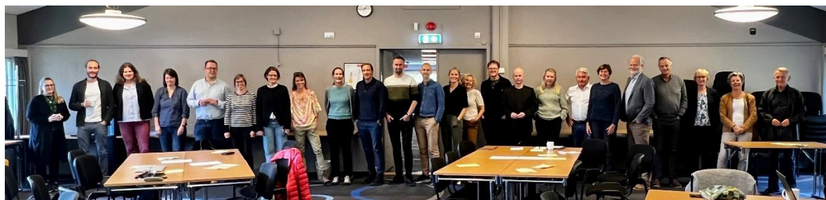
Seminar deltakere inndelt etter alder