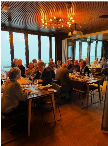
Festmiddag på Ulrikens topp

Årets NAFALM-samling gikk av stabelen på Hotel Terminus i Bergen. Som i fjor på Sommarøy ble høstsamlingen gjennomført sammen med Allmenmedisinsk universitetsmøte. Selve opplegget er som før for både NAFALM-samlingen og Universitetsmøtet. Men på posterpresentasjonene for andræarsstudentene, festmiddagen og fellesforelesningen samles alle deltakerne. Denne gangen foregikk posterpresentasjonene i de flotte lokalene i Alrek helseklynge. Deretter tok vi i samlet tropp gondolen til Ulrikens topp for en hyggelig festmiddag. Her fikk også avgangsstudentene sine velfortjente diplomer. Tilbakemeldingene på sammenslåingen har vært positive. Det oppleves som både nyttig og hyggelig å treffes på tvers av institusjoner og miljøer, både for stipendiater og seniorer.