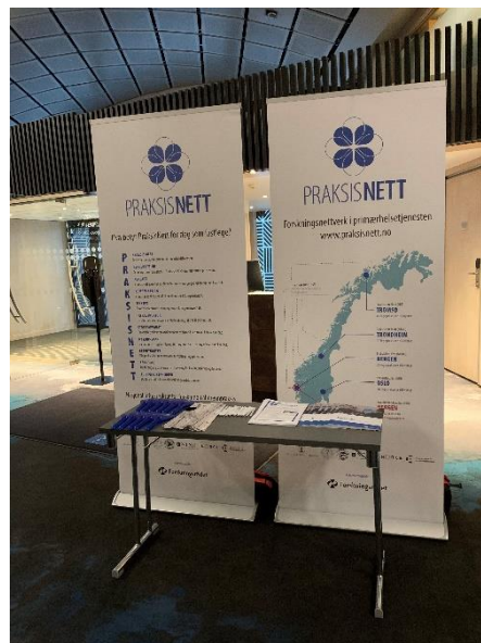
PraksisNetts stand på PMU