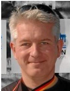
1.amanuensis 50 % Fastlege