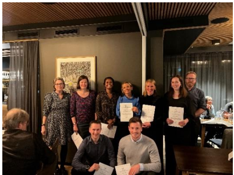
Kull 2020 har fått sine diplomer