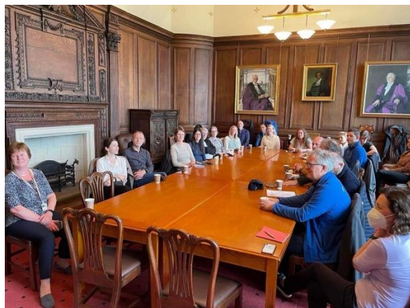
På studiebesøk ved University of Glasgow