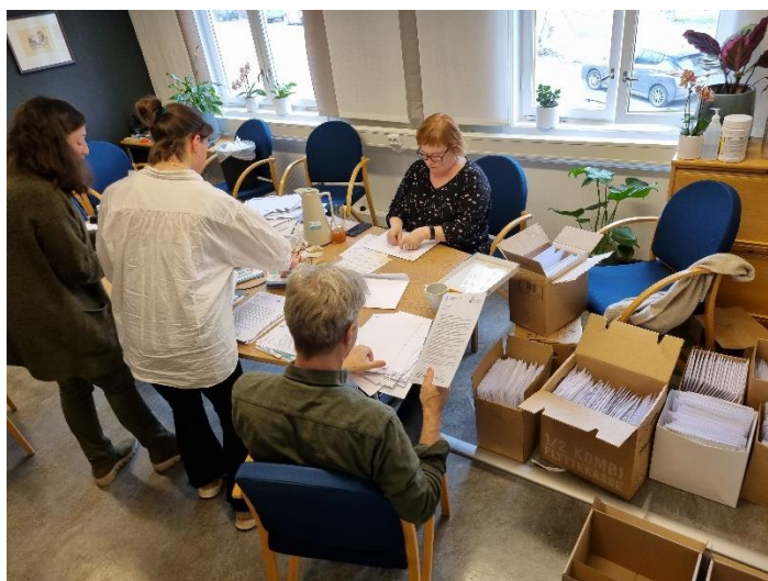
Dugnad på ASP: utsending av retningslinje-kortversjon til landets rundt 1000 sykehjem.

Revisjon og implementering av Nasjonal faglig retningslinje for antibiotikabruk i primærhelsetjenesten er en av våre hovedoppgaver. Hvert år gjennomgår retningslinjen en revisjon, godt hjulpet av vårt store fagnettverk på rundt 45 personer. Parallelt har vi jobbet med det vi kaller Håndbok i antibiotikabruk i primærhelsetjenesten. Denne skal inneholde relevant og nyttig informasjon som en støtte til selve retningslinjen. I 2022 utviklet vi også to kortversjoner av retningslinjen – en for sykehjem og en for allmennpraksis/legevakt. Kortversjonene er trykket opp og sendt ut til alle landets sykehjem, fastleger og legevakter.