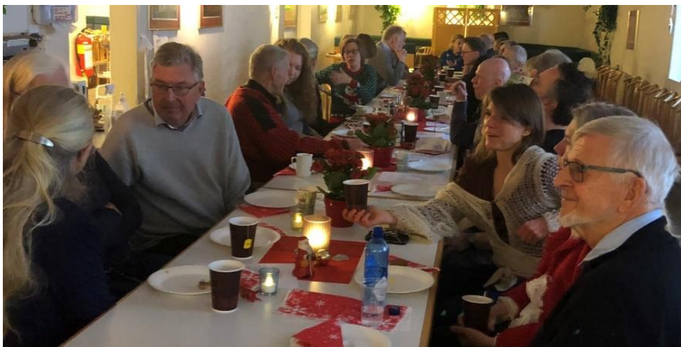
Julelunsj i 'kantina'