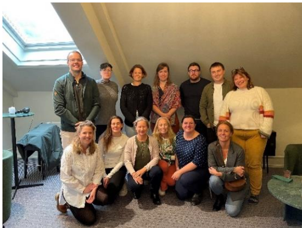
NAFALMs kull 2022

I 2022 tok vi opp skolens 10. kull, og denne gangen tok vi opp 14 stipendiater. Kullet består av 11 leger, en psykolog, en statsviter og en master i helsefremmende arbeid. Det er en ivrig gruppe stipendiater som allerede er godt i gang med sitt forskerskoleløp.