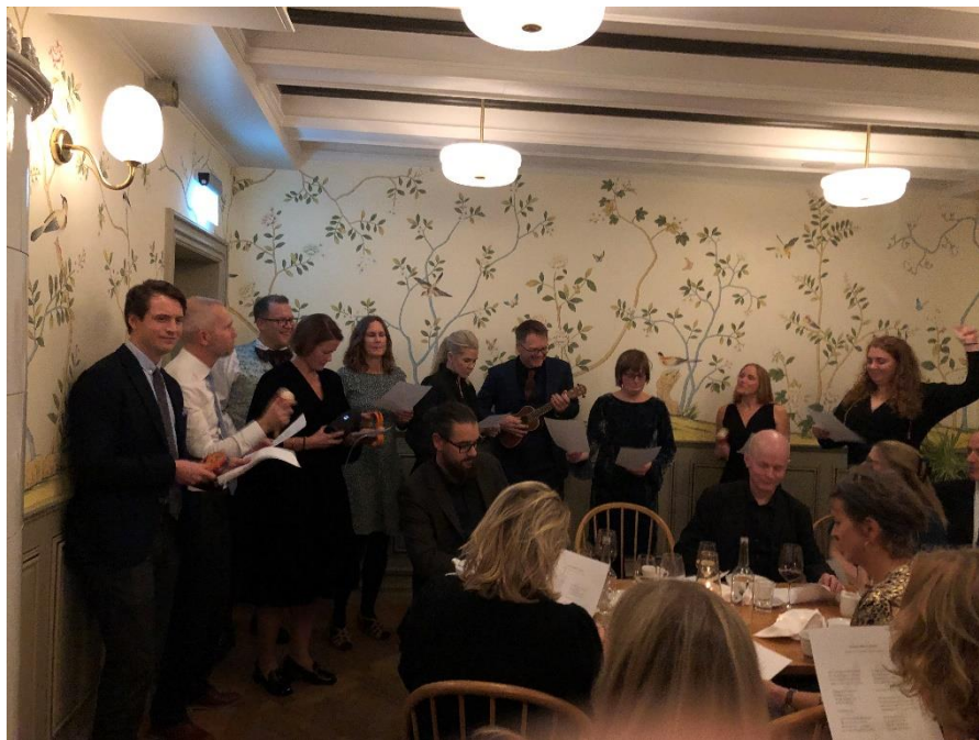
Stipendiatkoret gleder tilhørerne med vakker sang!

The focus for the young patients and their families should rather be on normality and coping with everyday life. Doctors must treat based on the biopsychosocial model. The model emphasizes that the problem has a biological, a psychological and a social side.