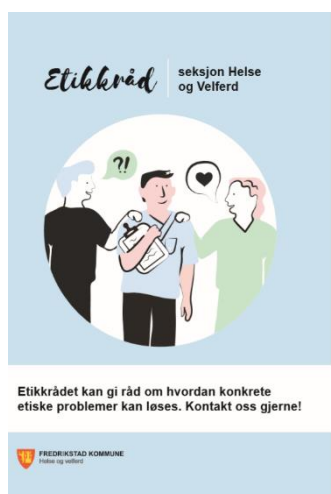
Forsiden på etikkrådets brosjyre.

Etikkrådets arbeid er presentert for politikerne i helse- og velferdsutvalget (januar 2019).