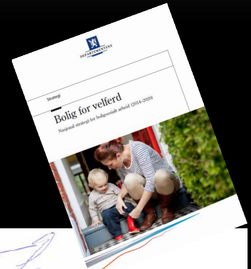
Robert Eriksson Arbeids- og sosialminister