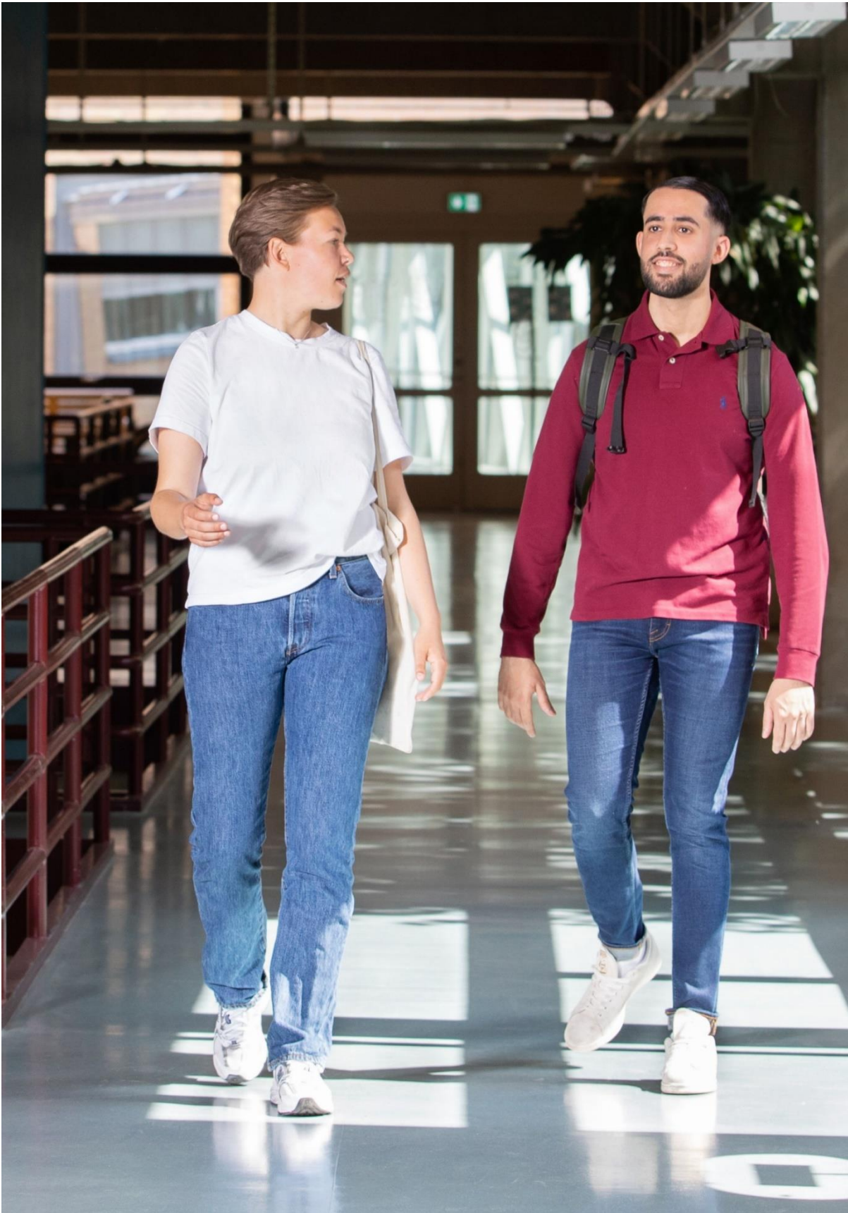
To studenter i Domus Medica