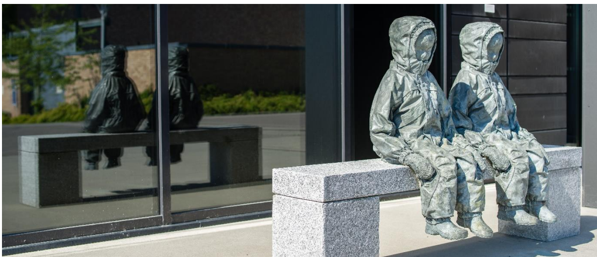
Studium (to barn) av Charlotte Gyllenhammar, utenfor Domus Medica på Gaustad.

Det medisinske fakultet skal videreutvikle ansattes virke og kompetanse i en fleksibel organisasjon.