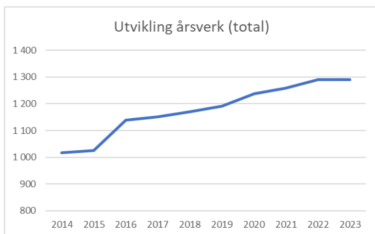
Graf 1: Utvikling årsverk totalt 2014 – 2023 (2023 per T2)

MED har hatt en jevn økning i antall årsverk (totalt) de siste årene. Andre tertial har MED et gjennomsnitt på 1285,7 årsverk. Antall årsverk vil svinge naturlig ilet et år, men vi ser per 2023 at årsverkutviklingen har vært relativt stabil de siste månedene.