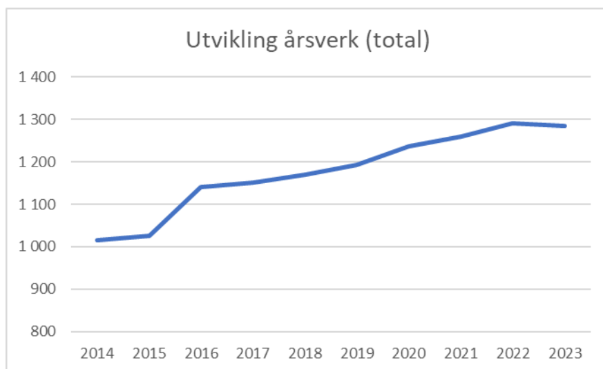
Graf 1: Utvikling årsverk totalt 2014 – 2023

MED har hatt en jevn økning i antall årsverk (totalt) de siste årene. For 2023 har med hatt en gjennomsnitt på 1285 årsverk, mot 1291 i 2022. Dette skyldes nedgang i årsverk på den eksterne virksomheten. Se tabellene under for splitt mellom årsverk på basisbevilgning og ekstern finansiert virksomhet.